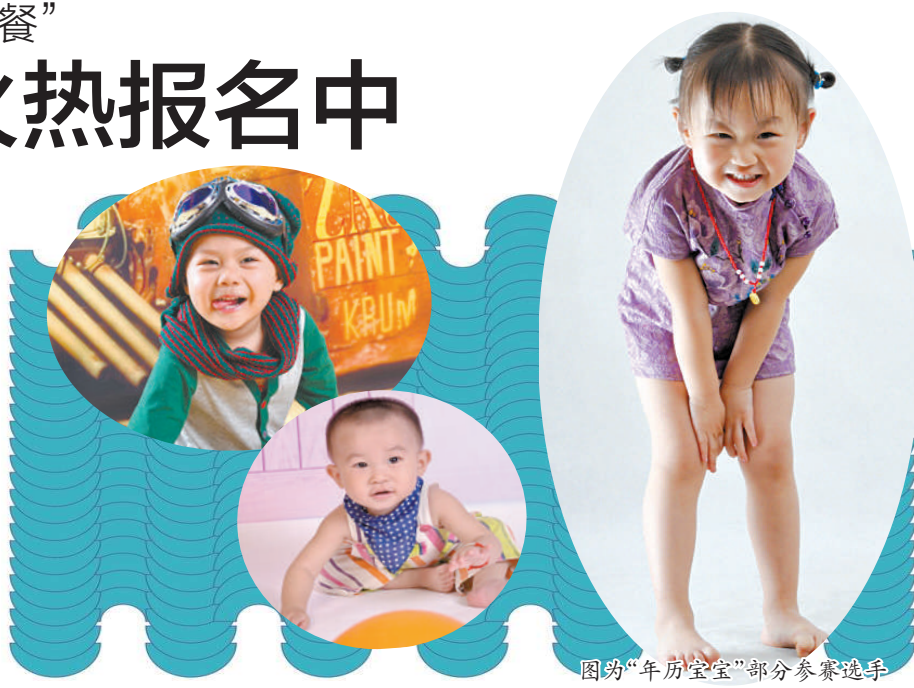
图为“年历宝宝”部分参赛选手

参与本次评选活动也有多种报名方式,分别为网络报名:登陆咸宁新闻网(www.xnnews.com.cn)进入专题报名;论坛报名:登陆咸宁论坛(bbs.xnnews.com.cn)跟帖报名;QQ号报名:43163163;邮箱报名:将宝宝照片、出生日期、联系方式发送至邮箱: xnnews@163.com。