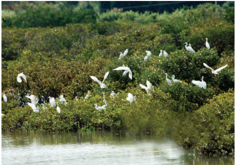
我的亲爱的孩子 我的黎明