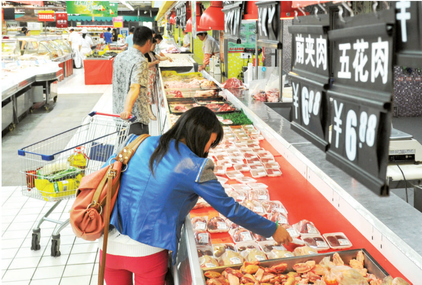
超市的肉摊上,猪肉价格小幅下降。

时之需。 此外,有关部门还可以在指导性价格上作调整,建立调节性基金,在生猪市场饱和、价格下跌时,可以直接补贴给养殖户或企业,减少他们的损失,起到抑制市场价格的作用。 有关人士还建议,鼓励和支持企业在社区试点建立直销店,减少流通中间环节。但从长远看,要从根本上解决好生猪市场大起大落,应该尽早推出生猪期货,开展订单生产,实现规避风险。