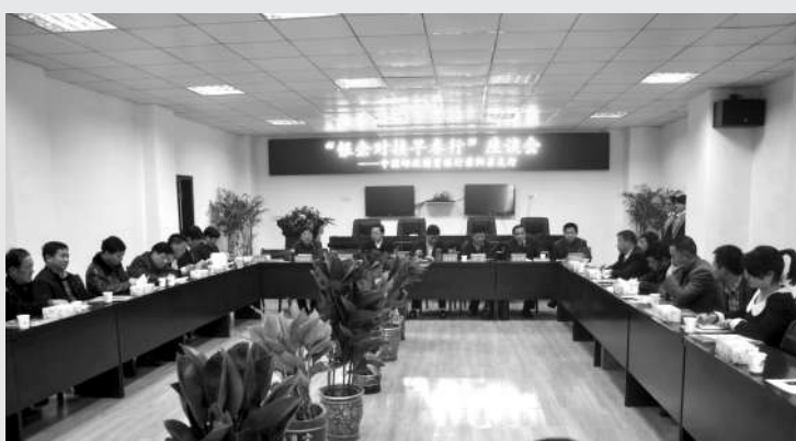
“银企对接早春行”座谈会

它卫生技术人员;优质企业总部正式员工等 产品优势:期限长、无需抵押、用途广泛。 个人汽车消费贷款 对象:年龄22—55周岁,具有完全民事行为能力能力的中国公民,以及在中华人民共和国境内连续居住满一年并有固定居所和职业的外国人以及港、澳、台人士。 产品优势:额度高、贷款方式灵活、流程简单、方便快捷。 办理流程 网点或电话申请—填写申请表—提交资料—接受贷款调查—等待审批—签订借款合同—发放贷款。