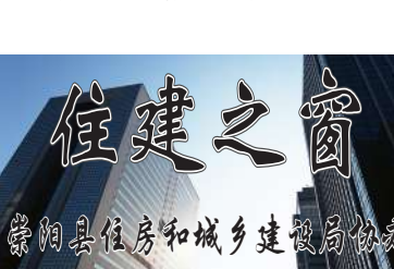
安全预控方面,深入开展对深基坑、大型或高层建筑施工安全隐患的排查治理工作,深化以防患起机械事故、脚手架、临边防护、施工坍塌和高处坠落为重点的安全整治工作,及时排除各种安全隐患,杜绝重大安全事故发生。在抓好工程硬件建设的同时,加强对工程软件建设的跟踪管理,达到施工资料、监理资料与工程进度同步进行的目标要求,并在工程竣工后及时纳入公司归档立案。

质量管理方面,严格审查施工队伍相关人员的资格、主要建筑材料出厂合格证明;把好建筑材料的检测关,从材料的取样到送检由现场跟踪监督;工程重要部位施工过程中必须实行旁站并做好记录,严格按照设计图纸和规范要求,对每一道工序和每一个环节进行核查监督,对发现的问题及时责令施工单位纠正整改。