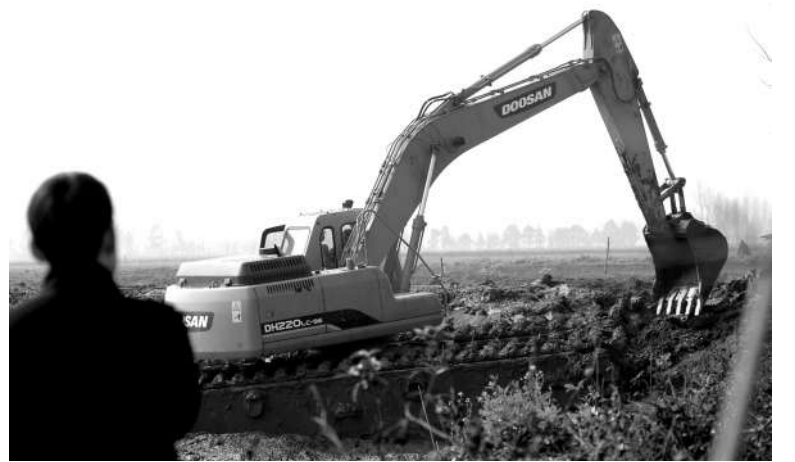
3日,咸安区向阳湖镇组织机械改造鱼池。春节过后,该镇投入机械230台(套),对60多口老化淤积严重的鱼池进行标准化改造,提高水产养殖产量,预计4月完工。 记者 袁灿 通讯员 陈伟 吴紫芬 摄

据介绍,墨谱自陈氏容海公后裔班辈十一代起列为以下:治、国、安、邦、显、永、世、回、隆、庭。陈宗南属于显字辈。希望知情者拨打本报新闻热线,帮助陈老圆了寻亲梦。