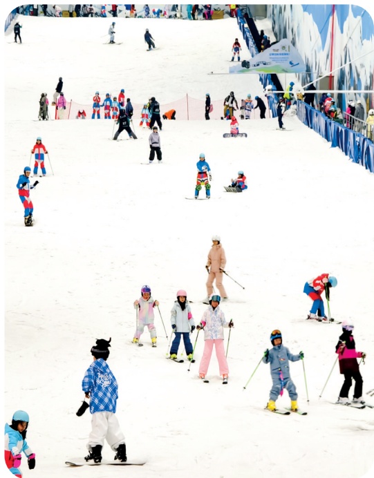
▲在际华冰雪·香城滑雪馆体验冰雪乐趣。

清明假期,全市各地深挖文化与休闲资源,精准对接不同群体需求,丰富产品供给、延长消费链条,让游客从