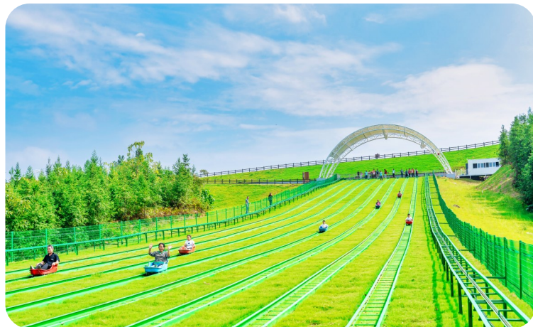
▲在嘉鱼蜜泉湖快乐游玩。记者 杜培清