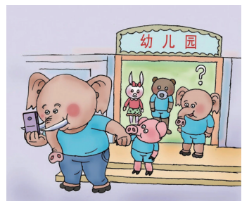
粗心的爸爸。