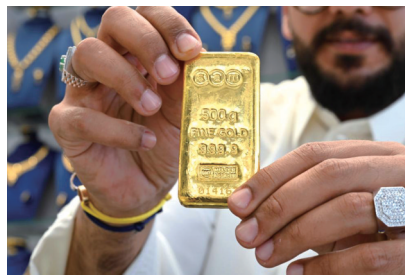
▲10月23日,在科威特首都科威特城,一名男子在金店内展示500克金条。