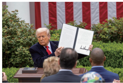
▲4月2日,美国总统特朗普展示签署后的关于所谓“对等关税”的行政令。