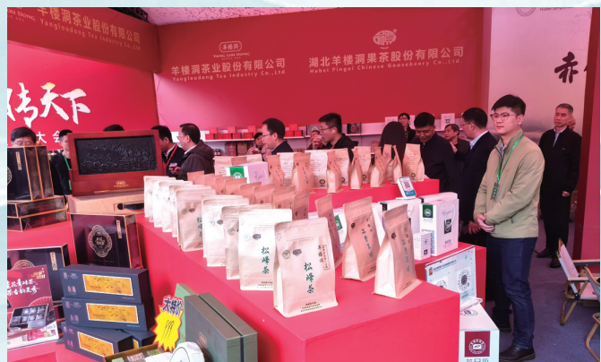
■本版图片由赤壁市摄影家协会提供