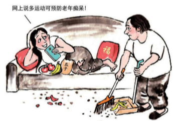
操心的小棉袄。