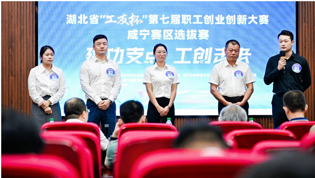
▲比赛现场,选手集中答辩