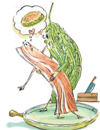
生活就像苦瓜酿。