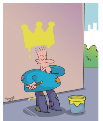
自我加冕。