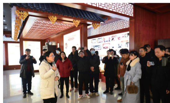
▲咸宁麻塘中医医院