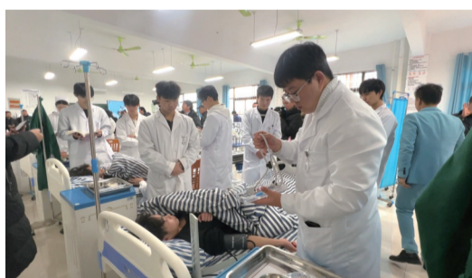
▲湖北健康职业学院