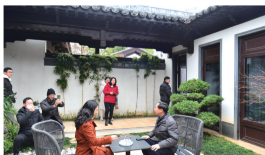
▲梓山湖·江南里医康养文旅融合体