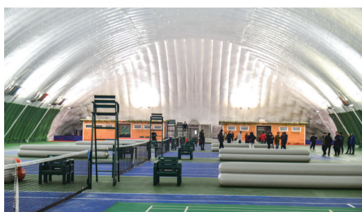
▲蜜泉湖大健康产业园运动中心