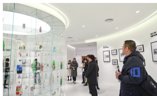
▲元气森林(湖北)饮料有限公司

活动中,采风团的网络大咖们还通过微博、抖音、视频号等平台发布视频、图文,并开设话题#聚焦咸宁大健康产业发展#,引起网友们点赞热议。截至发稿前,话题浏览量已经超4400余万人次。