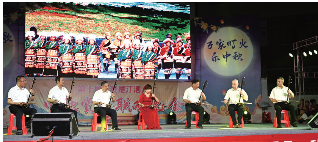
▲二胡齐奏《北京有个金太阳》