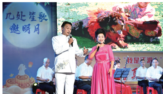
▲男女对唱《敖包相会》