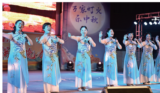
▲女声小合唱《洪湖岸边是我家》