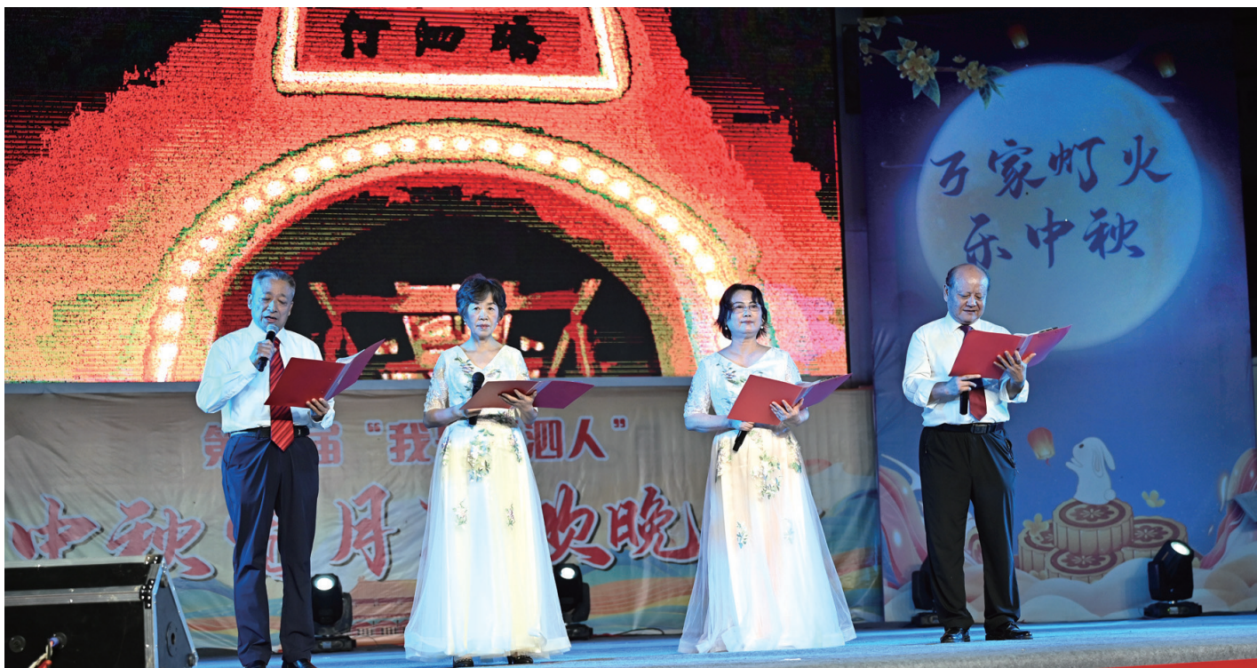
▲诗朗诵《我是汀泗人》