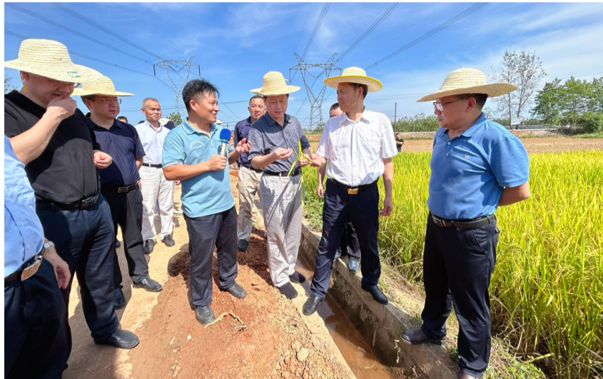
▲实地感受农业科技赋能农业生产

科技现代化。据介绍,我市将以此次与省农科院签订农业科技战略合作协议为契机,进一步深化市院合作,全力推进科技助力强县工程和农业科技“五五”工程,积极破解农业产业关键技术