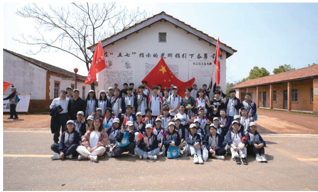
▲学生参观“五七”干校