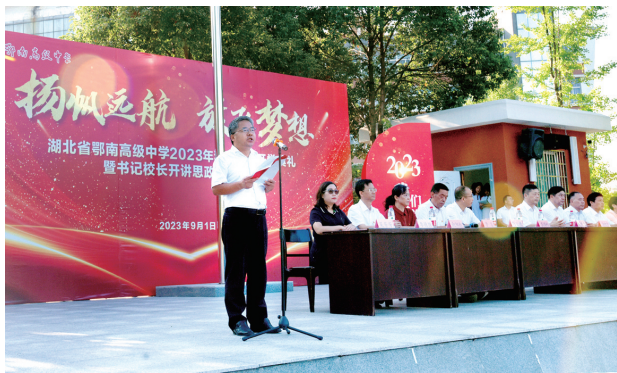
▲校长讲开学思政第一课

鄂南高中先后被评为“全国五四红旗团委”“全国贯彻学校体育工作条例先进单位”“全国群众体育先进单位”“全国地理教学先进集体”“全国校园环境文化建设先进单位”“全国学校营养工作先进单位”“中国人民解放军空军招飞工作先进单位”“信息化与基础教育资源均衡发展部共建协同创新中心实验校”。