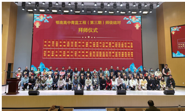
▲青蓝工程结对仪式