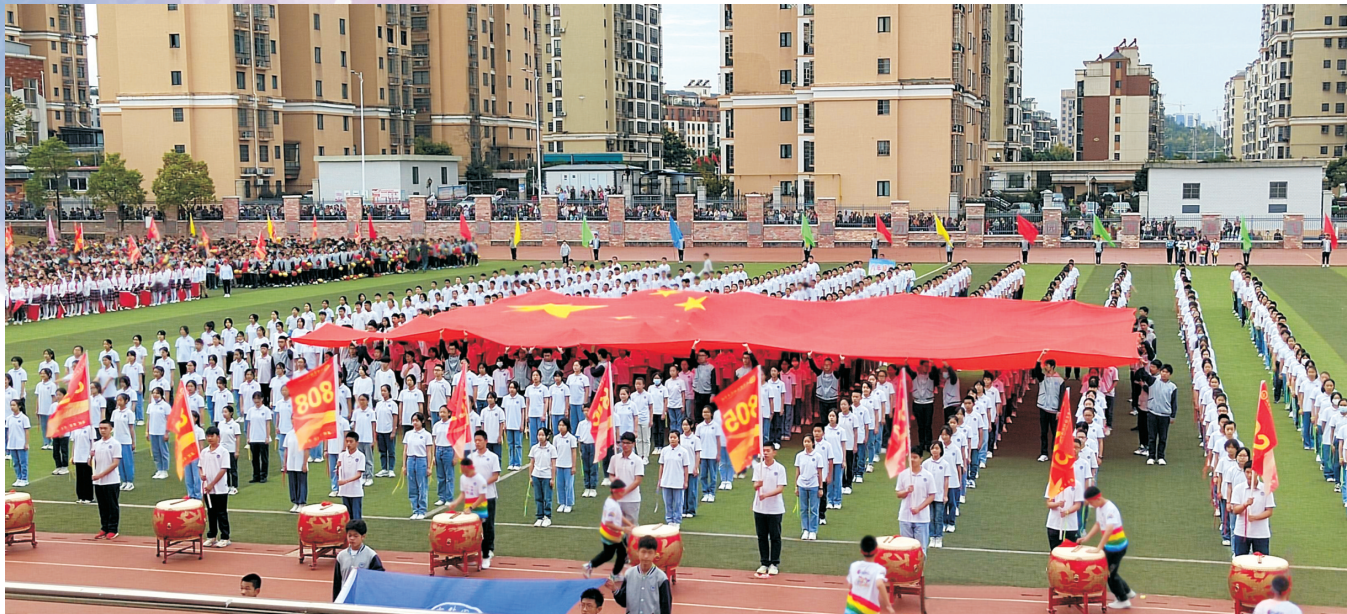
●通讯员 余琼 镇锦兰

教师有情怀,教育有力量。教师有担当,国家有希望。咸宁实验外国语学校秉承“教师是学校发展的第一资源”的理念,树立科学的教师发展观,不断提升教师的专业素养,打造一支师德高尚、理念先进、业务精良、爱岗敬业、务实创新的队伍,为学校向着更高质量、更高层次发展打下坚实基础。