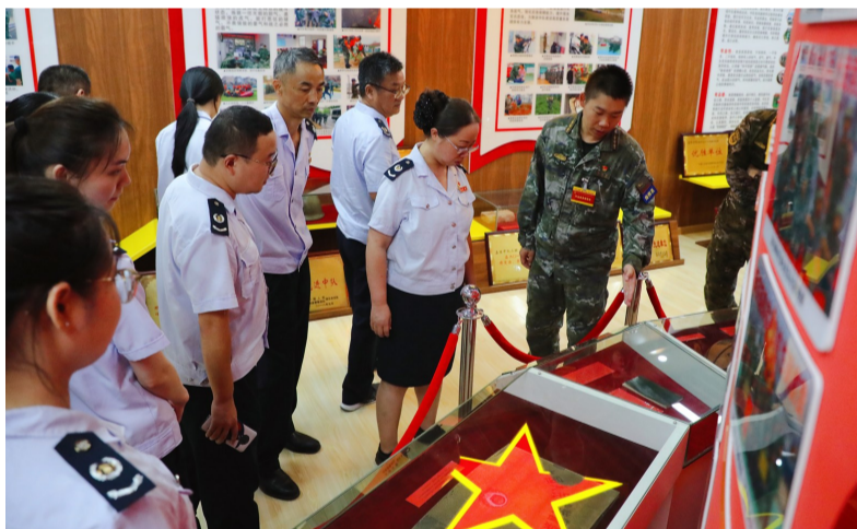
8月1日,国家税务总局咸宁高新技术产业开发区税务局组织军转干部和“蓝色训练营”营员来到武警咸宁支队嘉鱼中队,开展“携手进军