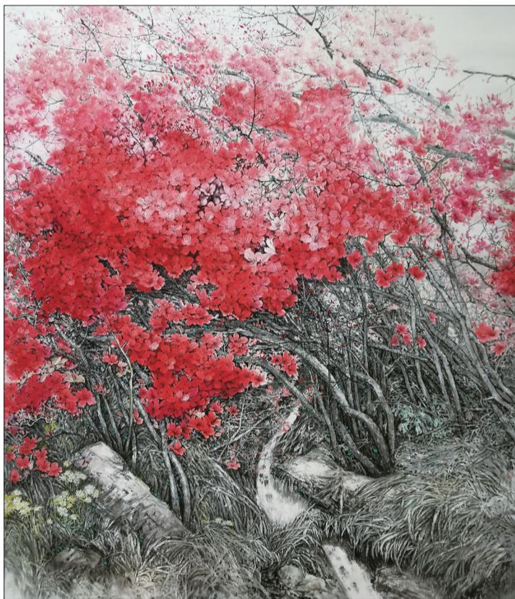
国画《杜鹃花开》孟清