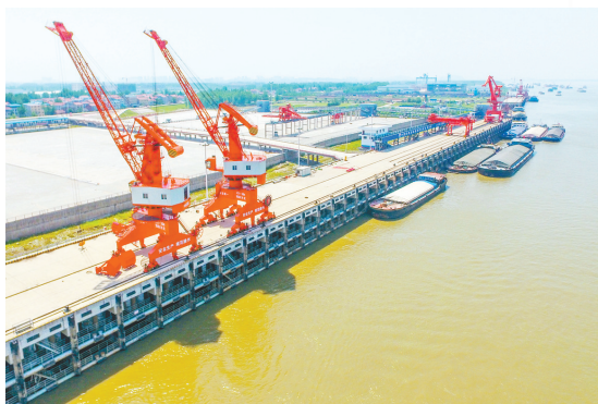
▲武汉新港唐家渡港区临港新城综合码头