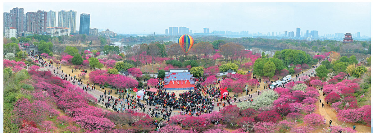
▲黄冈遗爱湖公园梅园风景区

黄冈高新区紧盯龙头扩项目,催生“三期”现象,带来实实在在的投资、实实在在的效益。目前,高新区有产值过10亿元企业7家,伊利、索菲亚、稳健三家企业税收均过亿元。