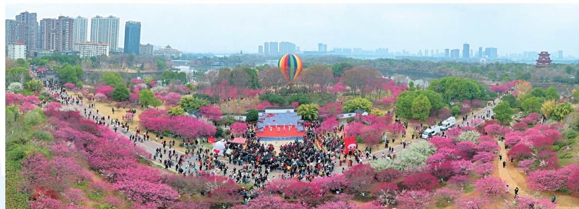
▲黄冈遗爱湖公园梅园风景区

黄冈高新区紧盯龙头扩项目,催生“三期”现象,带来实实在在的投资、实实在在的效益。目前,高新区有产值过10亿元企业7家,伊利、索菲亚、稳健三家企业税收均过亿元。