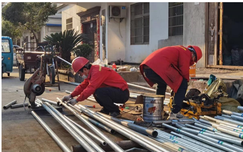
工,双泉社区3组即在此列。

其实,天然气中压管道已铺埋到3组村头,暂时没有入户安装,是因为还没有完全达到安装的条件。3组47户民房大多依青龙山东南坡而建,房屋错落无序致消防通道不畅,必须整改才能安装天然气,该市主城区需要接入气源的共有49个小区,至11月16日,其中47个小区已完成气源接入施