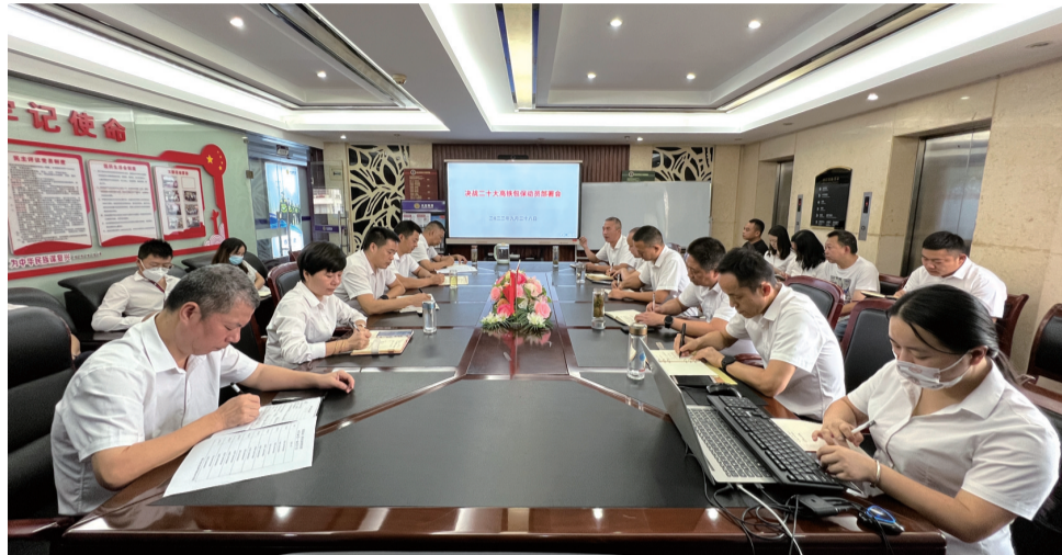
▲兴安集团召开包保动员部署会

9月26日至10月23日,兴安集团高铁中心、机场中心、地铁中心、普铁中心枕戈待旦,“5加2”与“白加黑”成为兴安人的备战常态,绷紧安全弦确保进京人员安检任务万无一失成为兴安人共同的奋斗目标。期间查获各类刀具、酒精、气体、液体及其他违禁品7万余件,有效处置各类投诉事件千余起、处置现场安全突发类事件等500余起,帮助旅客找回遗失物品600余件,累计收到旅客各类表扬信、锦旗等85次,涌现好人好事、正能量事迹360余起。最终在为期近一个月的工作中,兴安集团以无一例安全事故的成绩圆满“交卷”。