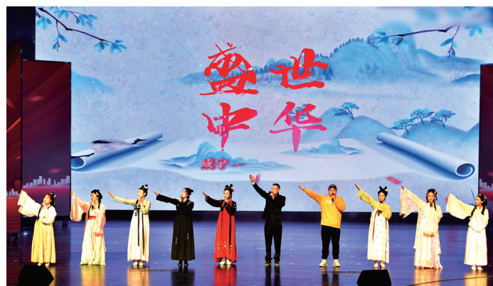
▲国风歌曲演唱《盛世中华》