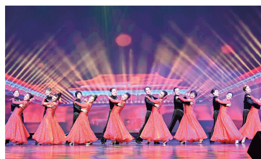
▲舞蹈《迎盛世 举金杯》