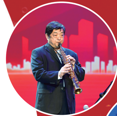
萨克斯表演《绿色的轻骑兵》