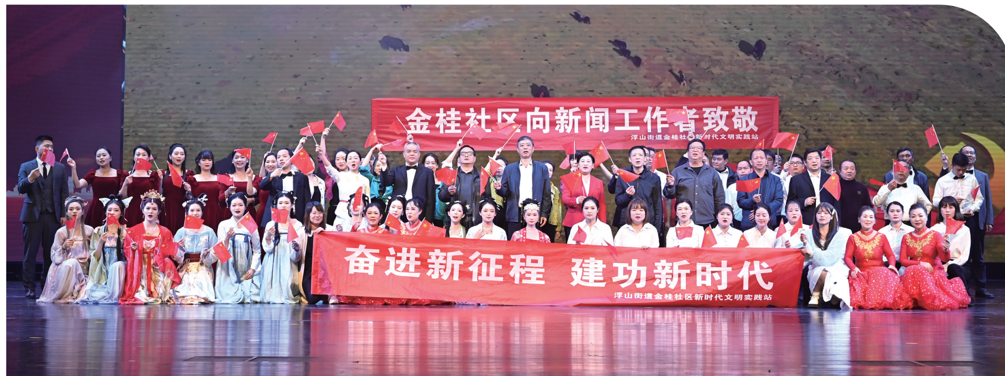
▲大合唱《我和我的祖国》