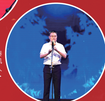
葫芦丝独奏《月光下的凤尾竹 阿瓦人民唱新歌》