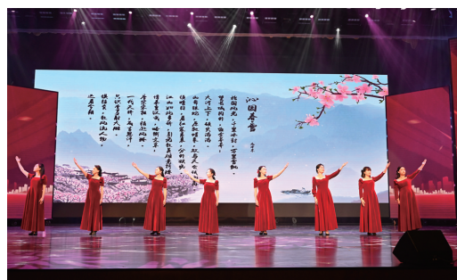
▲情景表演《风雅诗春秋》