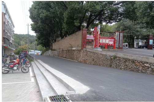
▲刷黑道路,设计台阶踏步