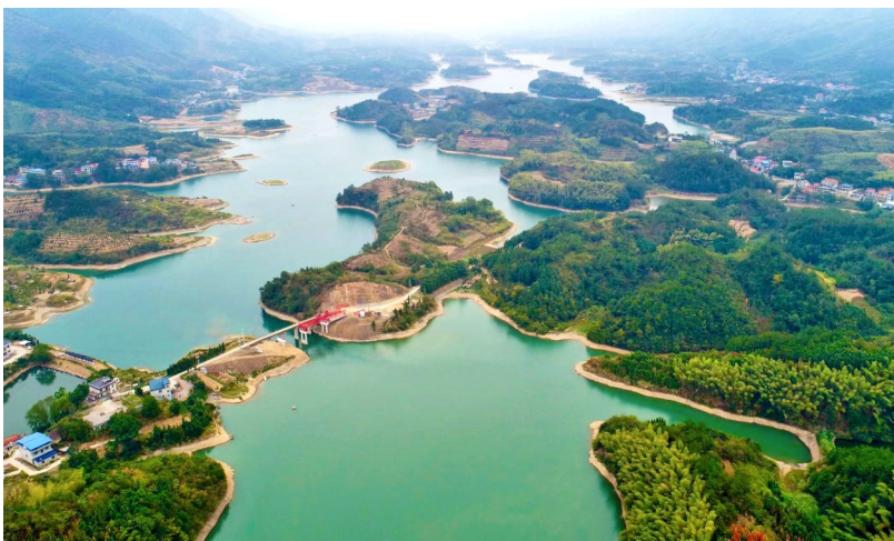
成了沿线测量放线,正在逐步分段开展征地以及苗木赔付,计划年底前完成3公里。

记者了解到,近几年,随着我市城市化进程加快,企业、居民增多,用水需求不断增加,水厂在夏季超负荷运转,主城区供水形势严峻。为解决主城区供水需求矛盾,提高主城区供水安全保障率,我市在今年正式启动主城区供水增量提质工程,增加主城区供水量。 据市政府投资项目建设管理局相关负责人介绍,经实地查看,王英水库水源取水点两岸柑橘成片,竹木成林,山泉众多,保护措施到位。根据相关检测数据,水库各项水质指标均优于地面水环境质量Ⅲ类标准,适宜作为城市供水水源。除了水质好外,在王英水库取水比在长江取水能耗低。 该负责人告诉记者,王英水厂内正在扩建制水生产线。从王英水库到王英水厂沿线38公里输水管道新建工作,已经完