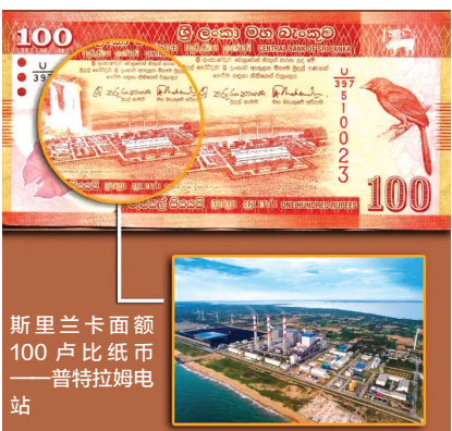
斯里兰卡面额100卢比纸币——普特拉姆电站

并移交通车,中俄黑河—布拉戈维申斯克界河公路大桥开通……泰国《亚洲时报》网站近日刊文指出,中国拥有世界一流的工程建造和技术能力。 “中国建造”坚持创新引领,为合作方发展“计长远”。本着对各国负责、对子孙后代负责的精神,中方在推进交通、能源、水利、电力等合作项目的時候着眼长远,发挥新技术优势,对接国际上普遍认可的规则、标准和最佳实践,统筹推进经济增长、社会发展、环境保护,让共同和可持续发展落到实处。自2017年“一带一路”科技创新行动计划启动以来,中国与相关国家开展合作,一批为未来而生的创新项目接踵而至。卡塔尔面额10里亚尔上的卢赛尔体育场是2022年卡塔尔世界杯主体育场,是世界同类型中跨度最大、最复杂的索膜结构体系建筑;在阿尔及利亚面额500第纳尔纸币上出现的由中国研制和发射的阿尔及利亚一号通信卫星,可以覆盖该国全境,为偏远地区民众提供通信服务。阿尔及利亚经济学家法里斯·马斯杜尔说,这“体现出中阿两国合作已达到重要的战略水平”。 “中国建造”助力发展中国家减贫,为其注入持久动力。根据世界银行预