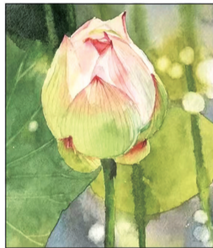
■水彩画《荷花》黄佳妮