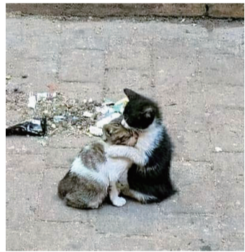
“别怕,我会保护你的。”