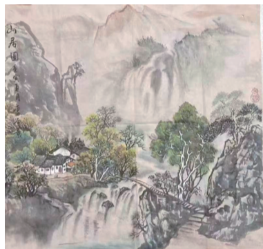
■国画《山居图》曹雪琴