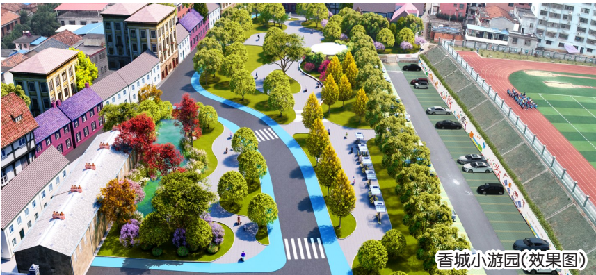
香城小游园(效果图)