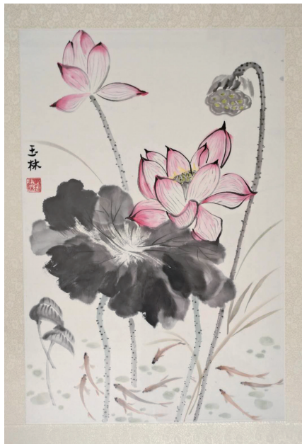
■刘玉林 荷塘鱼趣(国画)