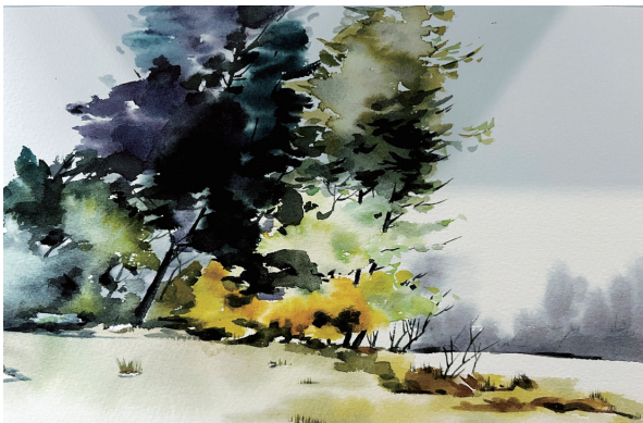
■余娟 《桂香秋色》水彩