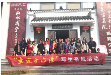
▲工作室师生参加咸宁市美术馆写生展览活动