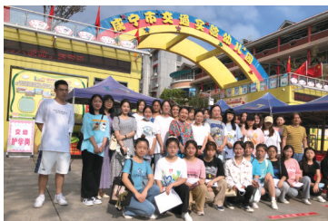
▲工作室师生参加市交通幼儿园课改活动掠影