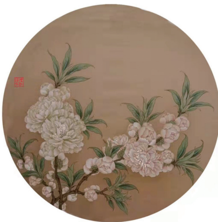
■冯秋萍 仿宋人笔意《樱花图》(国画)