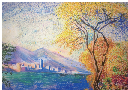
■吕露《秋日小景》水粉