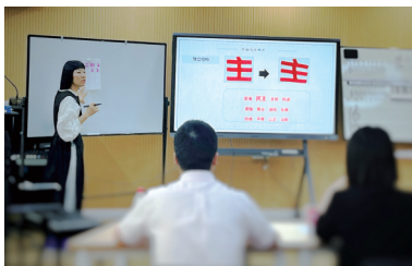
▲工作室教师课堂教学技能PK

咸宁职业技术学院人文艺术学院在学校培养实用型技能型人才的的发展环境下,于2020年开始建立技能工作室10个,其中美术工作室由美术教研室近10位老师组建而成,团队教师专业技能突出,作为人文艺术学院的教育类美术课程教学科研与社会实践的重要团体。成立初衷是为了培养学生的审美能力、文化素养、实践动手能力及美术设计创新意识。