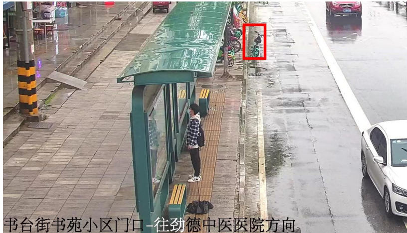
▲城市管理“千里眼”抓拍车辆乱停乱放(图中红框处)

在市中心城区，已有29个点位摄像头运行视频智能分析系统，分布在示范路、学校周边、集贸市场周边、公