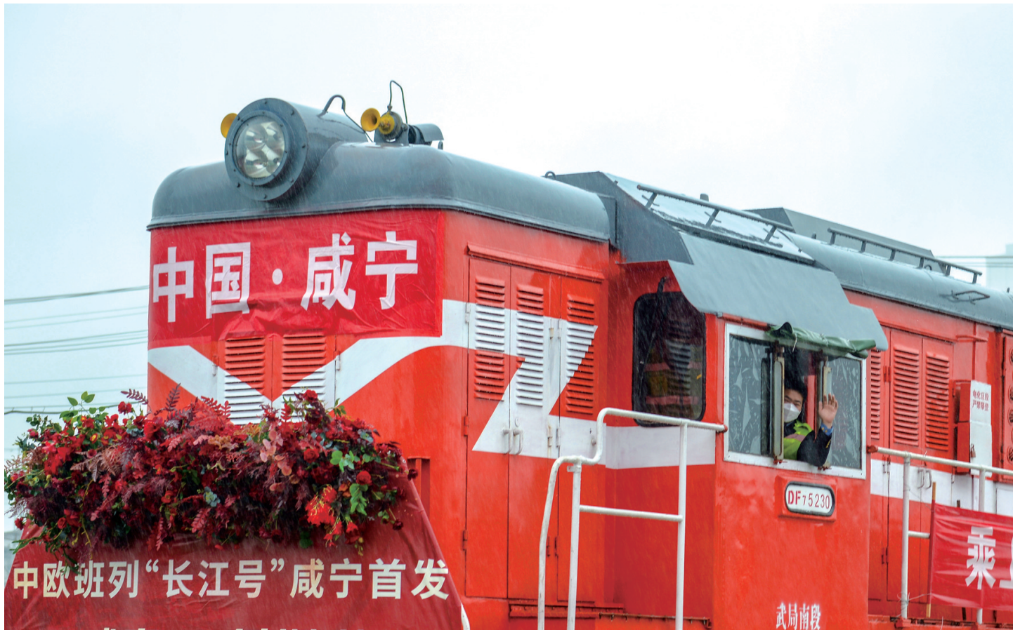
中欧班列“长江号”咸宁首发