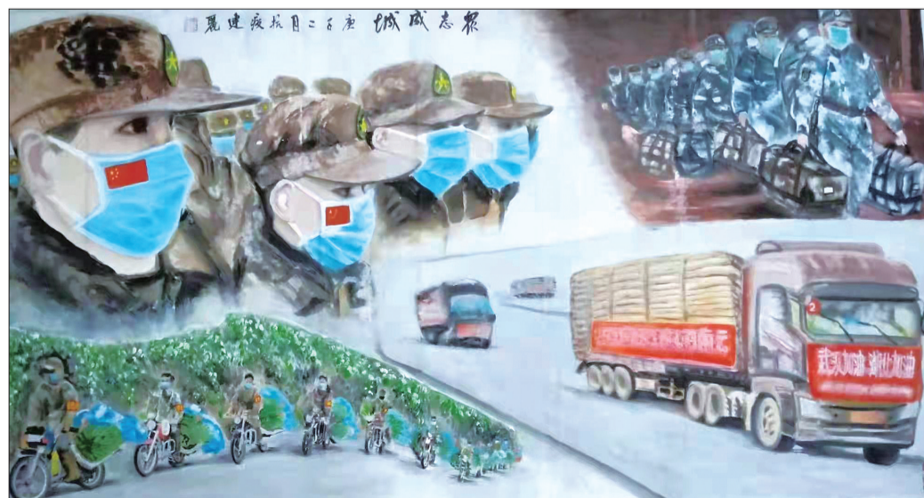
国画《众志成城》龚建丽