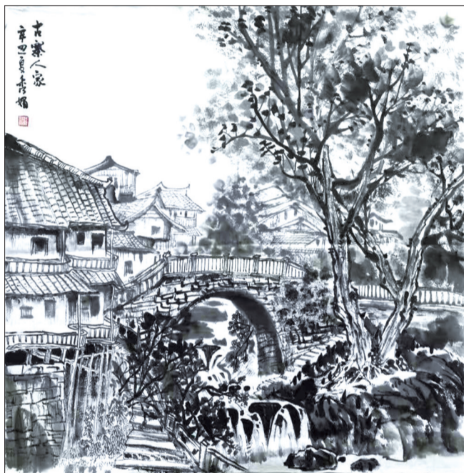
国画《古寨人家》李秀娟