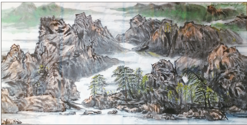
国画《青绿山水》 卢晓辉

远离城市的乡村屋顶 永远根植于游子心底 挥不去,抹不掉 塑铸成无法更改的秉性 幻变着五彩斑斓的风景