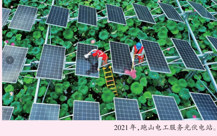
2021年,跑山电工服务光伏电站。

在创新的高原,“跑山电工”向着陡峭的峻岩攀登,降下又攀登! 战胜了难以登上的第一台阶的峻峭,出现在难上加难的第二台阶绝壁之前,他们迎难而上;在千仞深渊之前,他们马不停蹄;在无限风光之上,不断跑出高效率、跑出高科技、跑出高质量,以昂扬向上之姿,向着建设新型电力系统征程挺进!