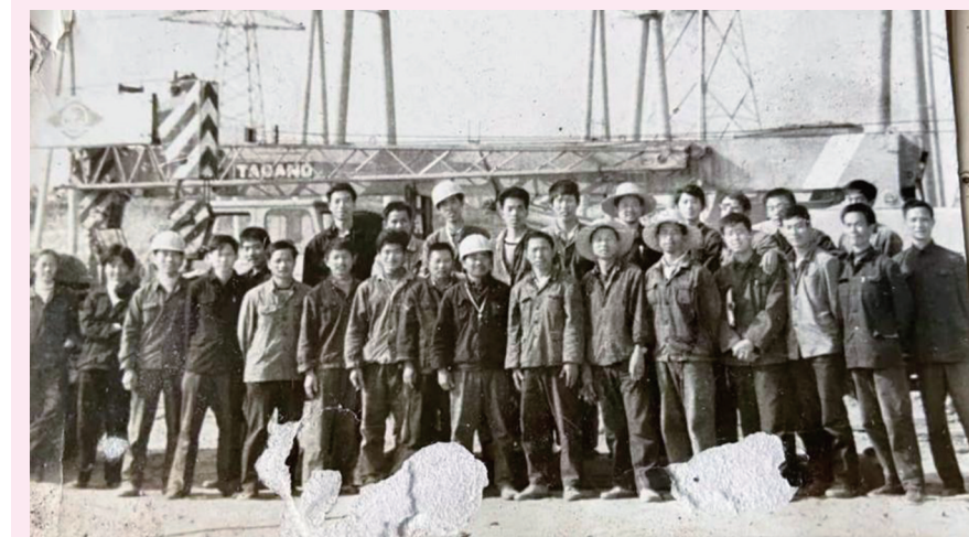
1984年,220千伏塘角变电站建设者。

青龙山下建电站,悬崖峭壁,巨石嶙峋,基础开挖难。所有项目都是无机械施工,“跑山电工”们在自己的铁盒里装上口粮,睡在简陋的工棚里,把“红灯已于青龙山下招展,明灯定在隼水两岸高悬”的口号刻进脑海,硬是在属于岩石层的青龙山