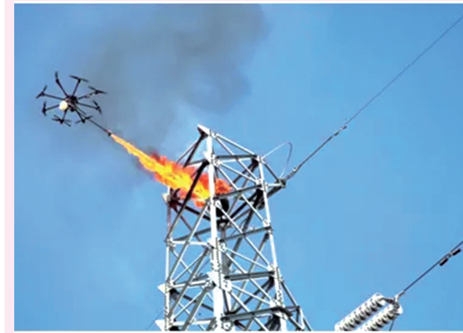
2016年,无人机高空喷水除隐患。

1974年,110千伏温泉变电站至110千伏潘家湾变电站开通全区第一条载波通道。调度员打电话“听不见”的问题初步解决。1976年,地调至县调载波通信网实现互联互通,咸宁电力正式拥有了自己的通信网。