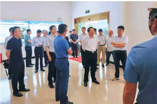
▲市长王远鹤调研餐厨废弃物无害化处理项目