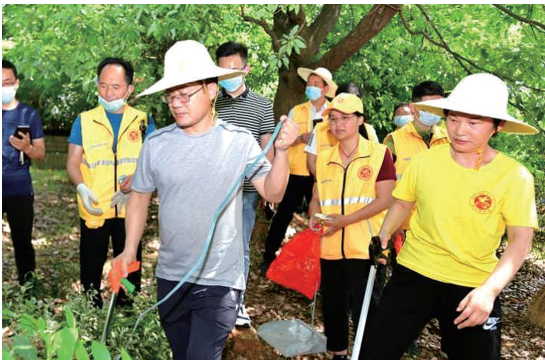
▲市委书记孟祥伟参加志愿者清洁活动

2021年10月26日是我省第24个“环卫工人节”，这是全社会弘扬环卫工人爱岗敬业、吃苦耐劳、默默奉献精神，推崇尊重、理解、支持环卫工人劳动成果良好风尚，激发社会正能量的节日。近年来，在市委、市政府和市城管执法委的坚强领导下，在全体环卫工作者的辛勤努力下，无论是环卫作业水平、队伍建设还是基础设施都有了新的提高，得到了广大市民的高度评价。截至目前，市城区已经规划建设改造了99座标准化公厕，24小时免费向市民开放；相继建成了市城区生活垃圾无害化处理厂、餐厨废弃物无害化处理厂、危废垃圾无害化处理厂、大件垃圾拆解破碎中心，市城区建筑垃圾资源再利用项目有望在今年底建成。至此，垃圾分类末端处理系统将全部投入使用，形成闭环系统。环卫战线涌现出以全市优秀共产党员钱玲利为代表的一批先进典型，环卫工人政治地位明显提高。实践证明，广大环卫干部职工在急难险重任务面前，经受住了各种考验，不论刮风下雨、酷暑严寒，日复一日，表现出了特别能吃苦、特别能战斗、特别能奉献的良好素质，在平淡的工作中，用勤劳的双手和辛勤的汗水换来了城市的洁净和美丽，以实实在在的行动担当起一份令人尊敬的责任，得到了全社会的理解、关心、支持和尊重！