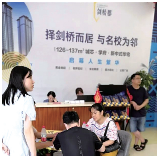
全媒体记者 周莹 黄兰芬

近年来,“学区房”虚假宣传广告,严重影响了消费者购房导向,市场监管、住建等部门接到有关投诉增多。近期,我市进行“学区房”虚假违法宣传专项整治。目前全市共检查楼盘80余个,发现涉嫌发布虚假违法“学区房”广告的有21个。