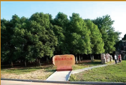
水滴石穿·崇阳廉文化园