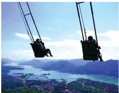
龙隐山旅游度假区

碧桂园凤凰温泉又名“栖凤泉”为东南亚巴厘岛风格设计的多功能室内外温泉,格调新颖,恬静幽雅,50余席公共温泉汤池依据地势高低起伏而设,在自然山脊中错落分布,山脊各温泉池与山底共同构筑成远近高低各不相同的景观,精巧别致,气象万千,浑然天成。这些别具特色温泉池各种花浴、药浴、牛奶浴任你泡让你在大自然中放松自我。 活动时间: 10月1日-11月30日 位置: 咸安区龙潭大道1号 电话: 0715-8819888