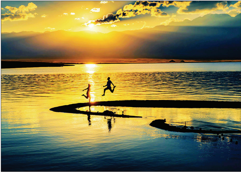
■摄影《夕阳有约》苗青