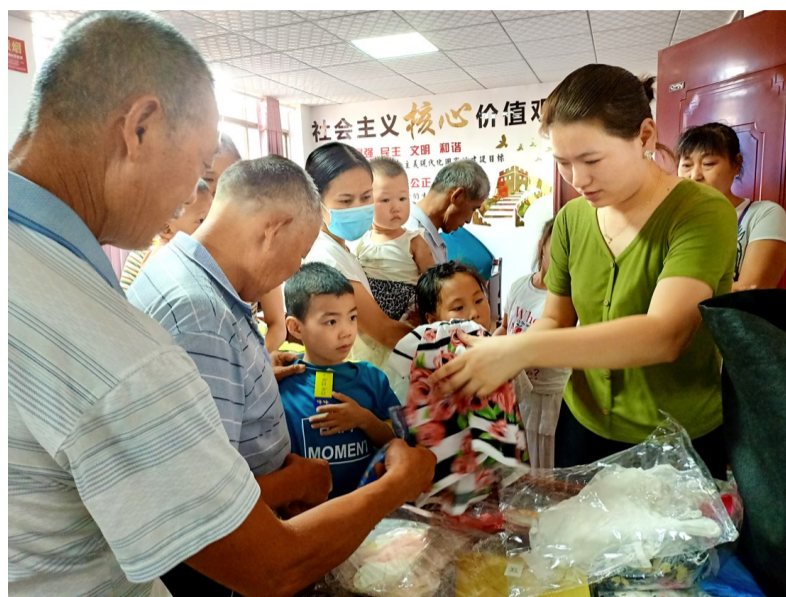
一份关怀,一份情谊。希望媒体和爱心企业、爱心组织、爱心市民多多关注这些困境家庭,为他们送去关怀和温暖。”该负责人说。