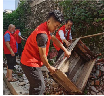
社区第一网格卫生死角进行彻底清理。 (记者杜培清 通讯员张勇军)

6月30日下午,市委社工委直属党支部所有党员和入党积极分子开展了卫生大扫除活动,对温泉