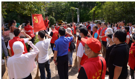
关心关爱活动和帮扶济困活动的形式展开。 (通讯员张奇勋)

活动现场,全体党员佩戴党徽,在党旗下,重温入党誓词。此次活动主要以爱国卫生运动、爱国卫生运动宣传、