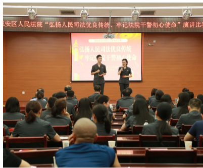
抒发法治信仰,用青春和激情演绎了法院干警昂扬向上的精神风貌。 (记者原子 通讯员陈桥)

来自该院各庭室和基层法庭的10名选手,立足法院审判执行工作实际,结合自身经历,用生动的语言和真挚的感情,从不同角度讲述法院故事,诉说法官心语,