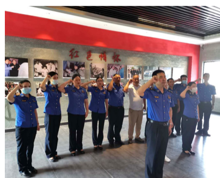
我市城市管理事业发展做出积极的贡献。 (通讯员张鹏 陈迅)

通过此次红色教育活动,各位党员深切感受到我党革命前辈和英烈不怕牺牲、为党为民的革命情怀,纷纷表示将进一步坚定理想信念,立足本职工作,爱岗敬业、履职尽责,发挥党员模范带头作用,为