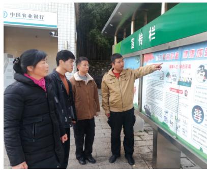
参加法制教育学习