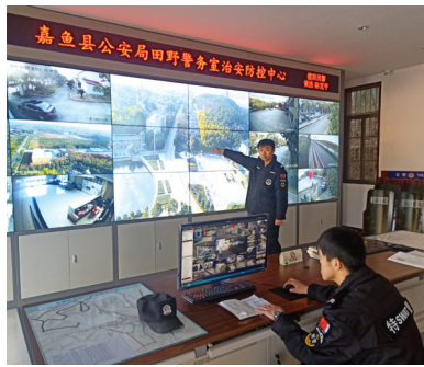
构建现代化的防控体系