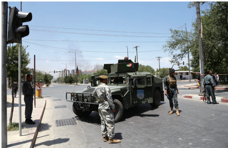
▲7月1日,在阿富汗首都喀布尔,安全人员在袭击现场附近警戒。

造多起袭击事件,多以阿政府机构和安全部队以及外国驻阿机构为目标。5月8日,一伙塔利班武装分子对喀布尔市中心的一个美国援助机构发动袭击,造成1人死亡。5月30日,喀布尔西部一座军事学院外发生自杀式汽车炸弹袭击,造成包括袭击者在内的7人死亡、6人受伤。