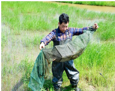
稻虾养殖拓宽增收路