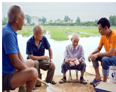
入股贫困户喜获分红