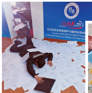
▲外交部全球领事保护与服务应急呼叫中心的工作人员,“炫”出一地文书。