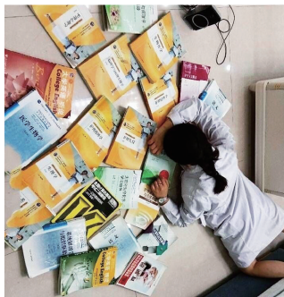
▲医务人员摔倒了,撒出一地专业书籍……