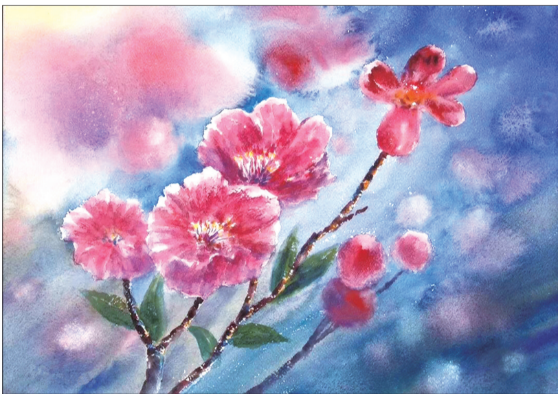
水彩画《花香世界》■周玉明